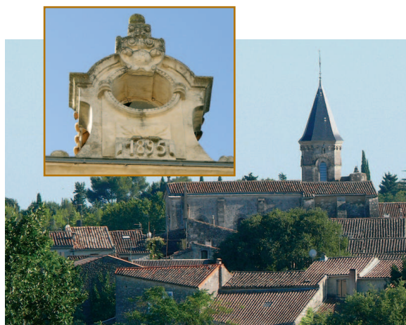
Réalisation : Mairie de Saint-Drézéry

La réputation d'une production de vins de qualité est ancienne sous l'appellation Saint-Drézéry. La présence d'une mièlerie importante témoigne de la pratique d'une agriculture peu polluante. Du fait de sa position sur le couloir des oiseaux migrateurs le territoire communal a été classé « zone importante pour la conservation des oiseaux ».