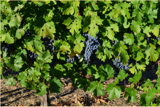
Depuis l'époque romaine la vigne est très présente sur notre territoire. Les productions se répartissent entre diverses appellations : Languedoc, Grés de Montpellier, St Drézery, Muscat de Lunel, Pays d'Oc