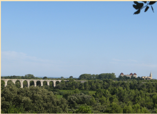
Il a été réalisé à l'initiative du Marquis René Gaspard de la Croix de Castries, qui fit appel en 1670 à Pierre Paul Riquet, l'audacieux ingénieur du Canal du Midi. Cet aqueduc devait amener sur demande de Le Nôtre architecte et paysagiste du Roi Louis XIV l'eau au parc du château.