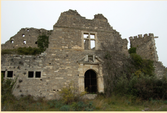
Edifié au XIème siècle sur une position stratégique, le château de Montlaur a été incendié en 1622 par les troupes du Duc de Rohan à la tête d'une armée protestante