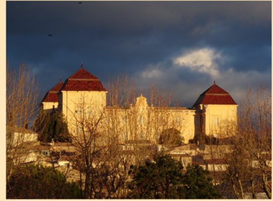
Construit sur le site d'un ancien Castrum romain dominant la Via Domitia, le château est mentionné dans les actes dès le XIème siècle. En 1565, Jacques de la Croix fait construire le château actuel. Incendié en 1622, René Gaspard de la Croix de Castries entreprend sa restauration et demande à Le Nôtre d'aménager les terrasses et le parc