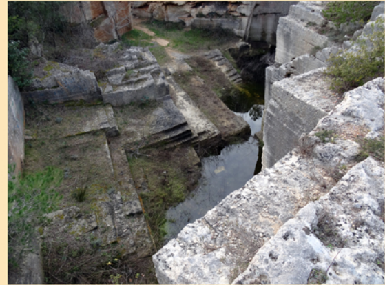
Les carrières sont très présentes sur notre territoire et sont exploitées depuis le XIIIème siècle comme à Beaulieu, Castries, Saint Génies des Mourgues, Sussargues. Un sentier balisé en jaune appelé « sentier des 4 carrières » permet de les découvrir